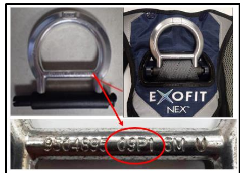
Step 1 Manufacture Date on Harness Shown in Red Circle – must be between 16/01 (2016, January) and 18/12 (2018, December)